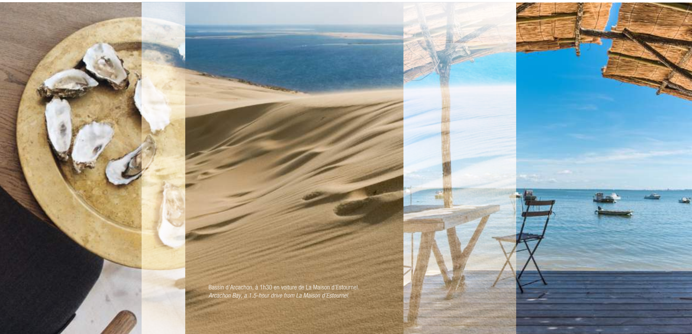
Bassin d'Arcachon, à 1h30 en voiture de La Maison d'Estournel. Arcachon Bay, a 1.5-hour drive from La Maison d'Estournel.