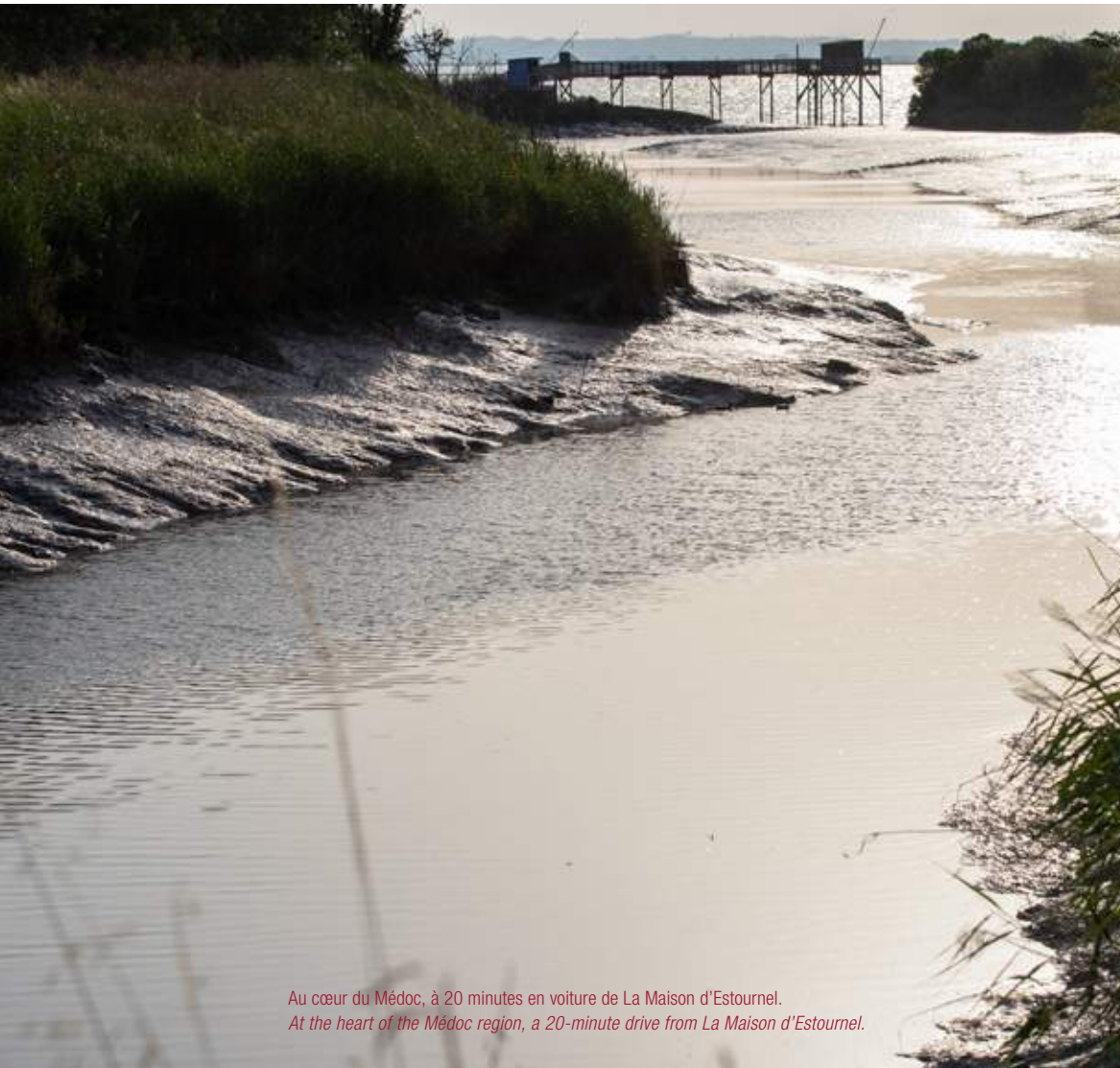
Au cœur du Médoc, à 20 minutes en voiture de La Maison d'Estournel. At the heart of the Médoc region, a 20-minute drive from La Maison d'Estournel.