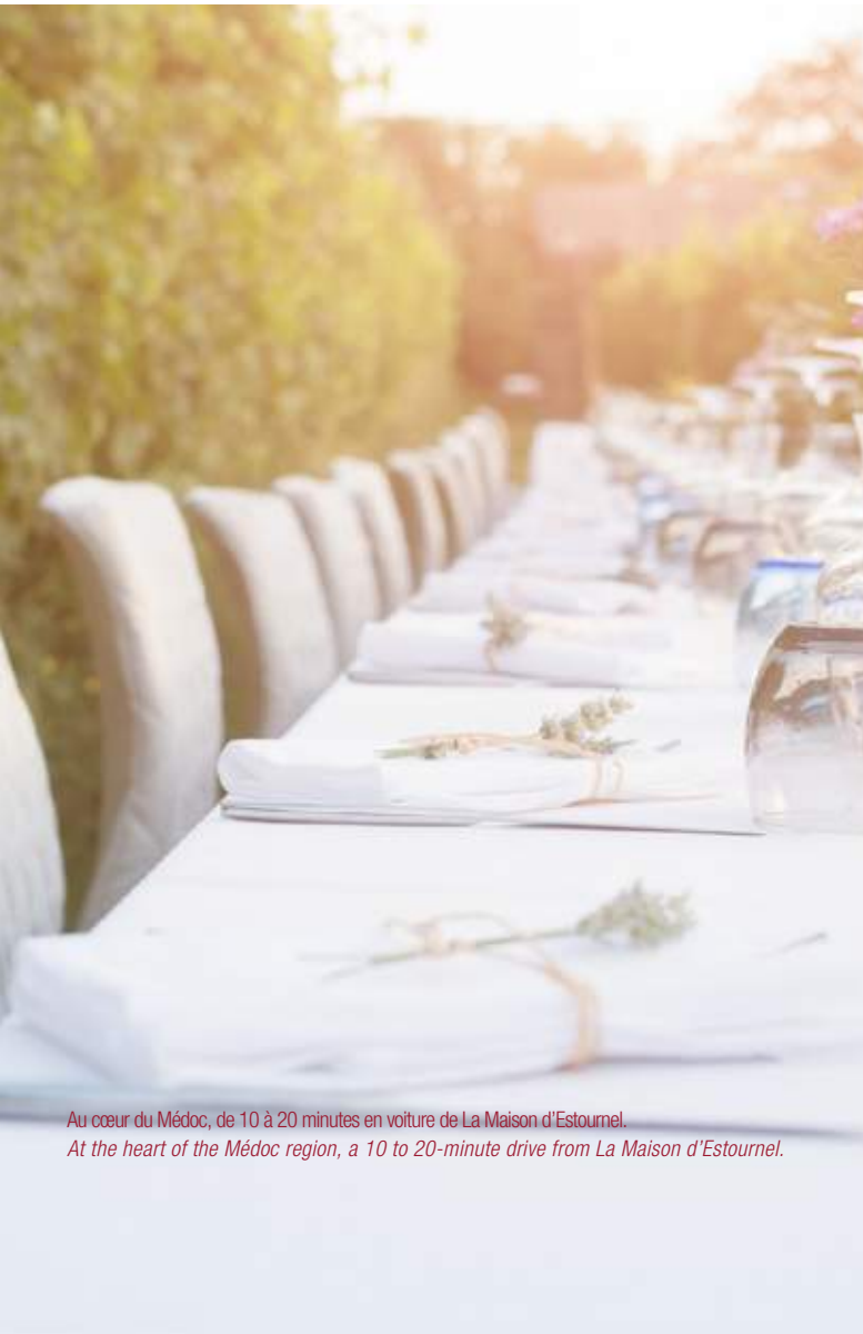
Au cœur du Médoc, de 10 à 20 minutes en voiture de La Maison d'Estournel. At the heart of the Médoc region, a 10 to 20-minute drive from La Maison d'Estournel.