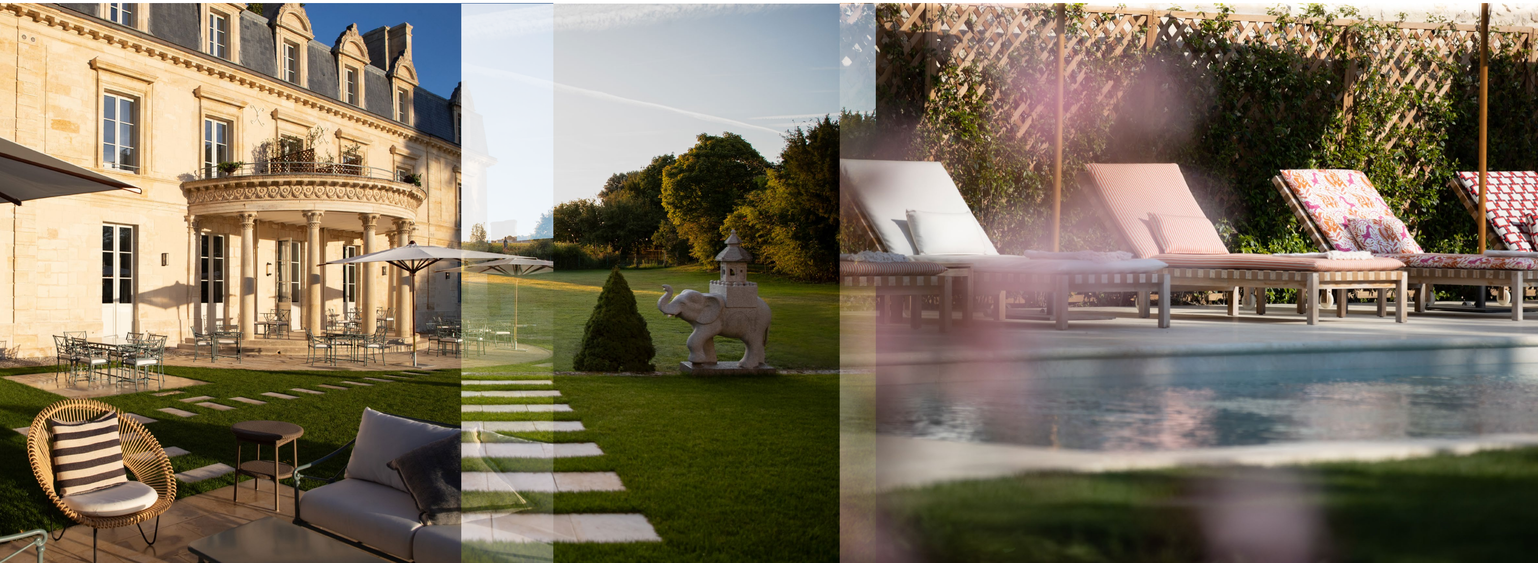
Ici, le temps semble soudain ralentir, pour laisser place à un rythme oublié dans un lieu délicieusement calme et préservé à 1 heure de Bordeaux. Here, time suddenly seems to slow down, giving way to a forgotten rhythm within a deliciously calm, unspoilt place just one hour away from Bordeaux.